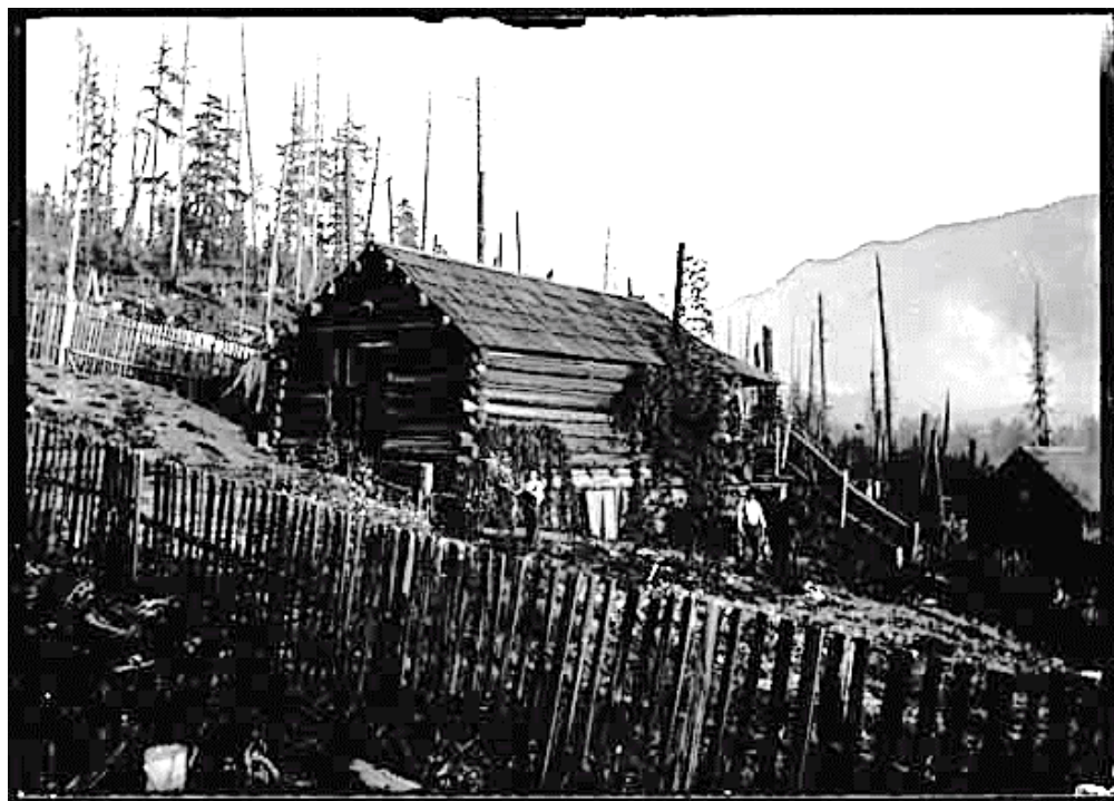
Figure 6 – Propriété familiale des Gunterman à Beaton – v. 1900-NIS