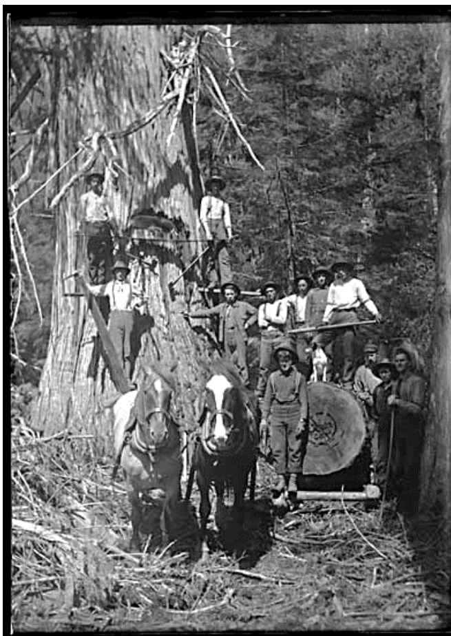
Figure 3 VPL-1803-Photo de Mattie Gunterman – NIS