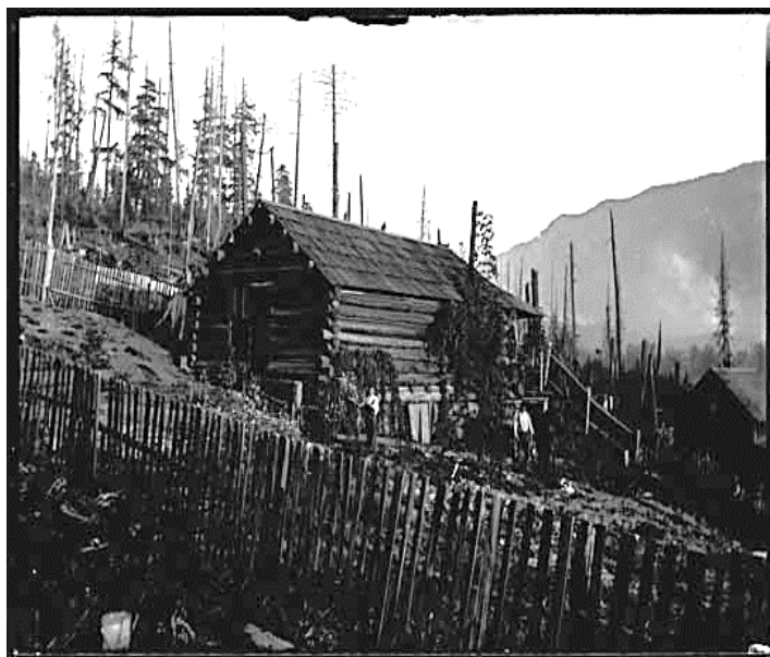
VPL-2222-Propriété de la famille Gunterman à Beaton v.1900