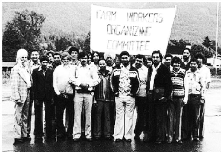
Comité d'organisation des ouvriers agricoles