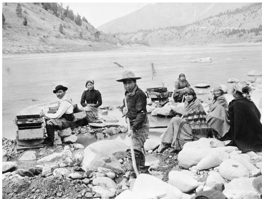
Figure 2 Item D-06815 - A First Nations family placer mining with sluice boxes and gold pans at the confluence of the Thompson and Fraser River near Lytton; Chief Charles Brown's mother is second from the [left]

Titre : Intérieur d'une cabane de mineur; mineurs blancs et chinois Titre : Intérieur d'une cabane de mineur; mineurs blancs et chinois prenant un repas ensemble