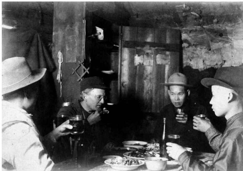
Figure 1 Item A-06021 – Interior of Miner's Cabin; White And Chinese Miners Share A Meal Together; Williams Creek.

Titre : Intérieur d'une cabane de mineur; mineurs blancs et chinois Titre : Intérieur d'une cabane de mineur; mineurs blancs et chinois prenant un repas ensemble