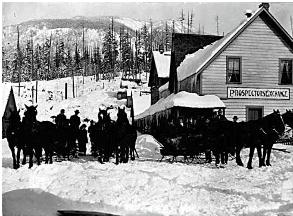
Figure 1 VPL-103 – Groupe devant l'hôtel Prospector's Exchange – v.1898-NIS

Sources des images : Collection de photos historiques, Vancouver Public Library. Ces photos appartiennent au domaine public.