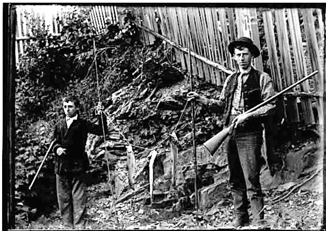
Figure 9 VPL-2218 – Deux jeunes gens avec un poisson – v.1905 – NIS