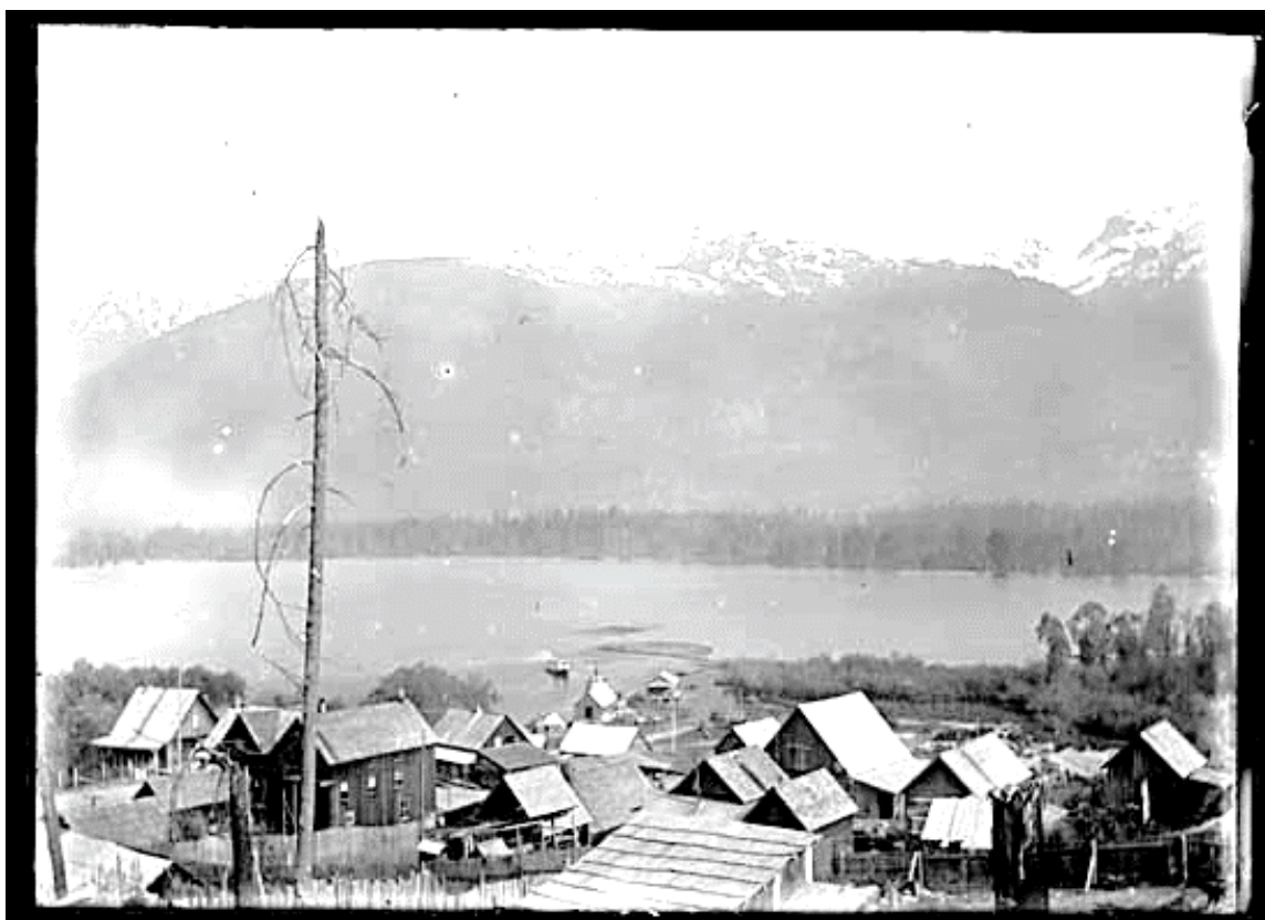
Figure 7 VPL-2224 – Vue de Beaton – v. 1902-NIS