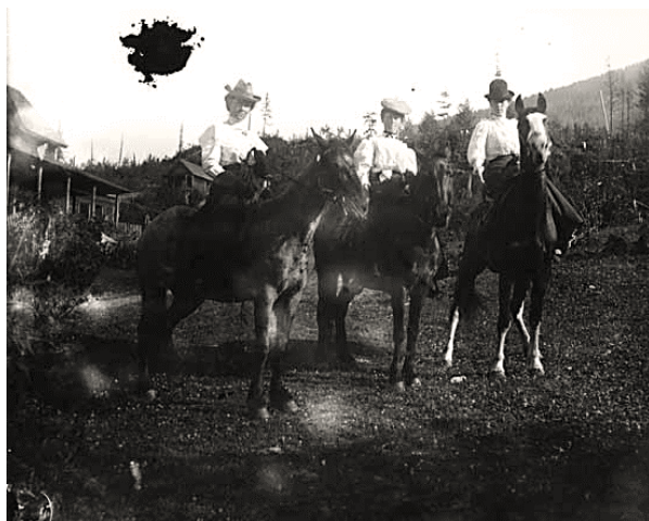
VPL 2 225 Trois femmes à cheval, v.1900

Un Henry Gunterman vieillissant jugea que les photos de sa mère seraient plus en sécurité dans la Bibliothèque publique de Vancouver que dans son grenier, où elles étaient à la merci des voleurs et des rongeurs. Il fit ainsi don de l'ensemble de la collection de plaques à Ron D'Altroy pour qu'il la ramène à Vancouver et la mette en lieu sûr afin de la préserver et de la mettre un jour à la disposition du public. Il existe presque 300 images dans la collection photographique Ida Madeline Warner (Mattie) Gunterman. À ce jour, 150 d'entre elles ont été numérisées.