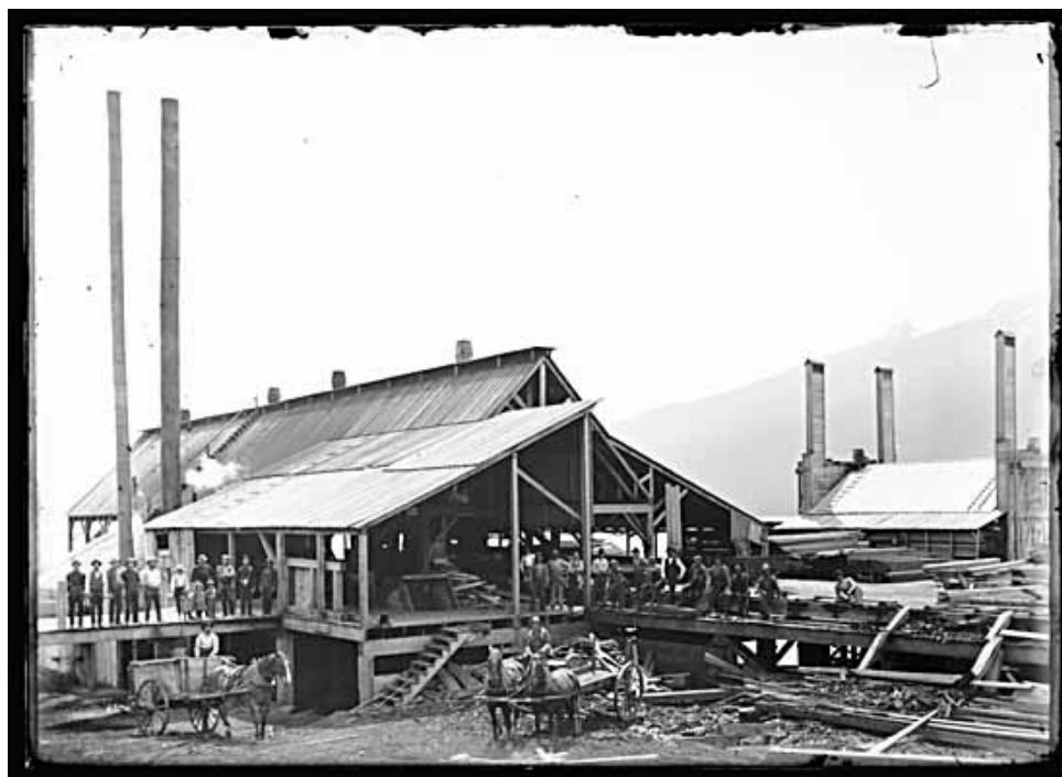
Figure 2 VPL-1802 – Équipe d'abattage du camp 3 à l'heure du dîner – 189-NIS