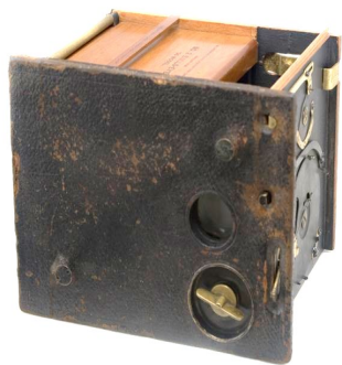
Appareil photographique « Bull's Eye » de Kodak, v. 1897

Le « Bull's Eye » était l'un des premiers appareils photographiques fabriqués par Kodak et Mattie en fut l'une des toutes premières utilisatrices. L'appareil sortit en 1896 et fut produit jusqu'en 1913. Le couvercle de la boîte s'ouvrait sur un bel intérieur en bois contenant deux rouleaux sur lesquels on fixait une pellicule de douze poses destinée à prendre des clichés de 3,5 x 3,5 po (8,89 x 8,89 cm). L'appareil était muni d'un simple obturateur à disque rotatif contrôlé par un ressort et de butées de disque rotatif actionnées en tirant un levier placé sur le dessus. Il contenait également un cache intégré qui donnait la possibilité de prendre des photos rondes ou carrées.