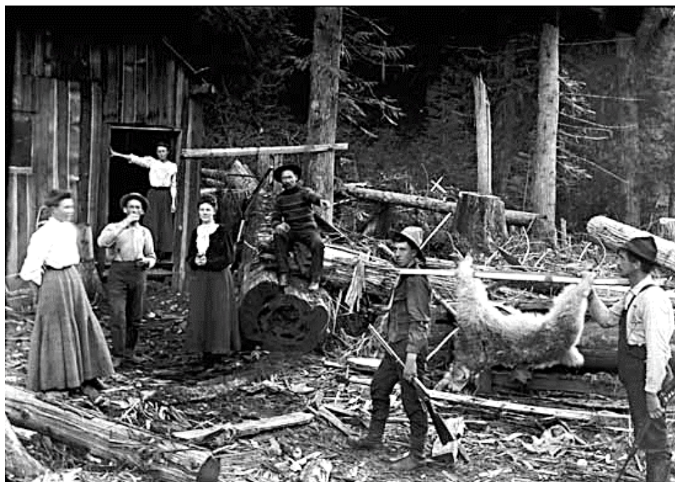
VPL-2216 – Femmes et chasseurs avec chèvre de montagne – v.1905-NIS.jpg